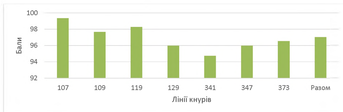
Рис. 3. Індекс СІВЯС з оцінки продуктивності кнурів

Висновки. Аналіз середніх значень показників продуктивності свиноматок довів, що за показником багатоплідності вони відповідають I та II класу, а за масою гнізда при відлученні – еліта та I клас, згідно з інструкцією бонітування свиней. Відповідно слід звернути особливу увагу на покращення показника багатоплідності.