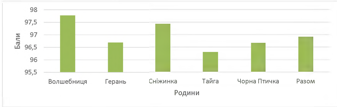
Рис. 2. Індекс СІВЯС в розрізі родин

Виходячи з результатів можна зробити висновок, що наявна певна генетична консолідація стада, оскільки немає великої різниці по продуктивності в розрізі родин. Лише за кількістю поросят при народженні була достовірна різниця між родиною Сніжинка (найвищий показник по стаду) та родиною Тайга (найменший показник по стаду) - t=2,91 , мали достовірну різницю в межах 5 % рівня значимості - p \leq 0,0083 .