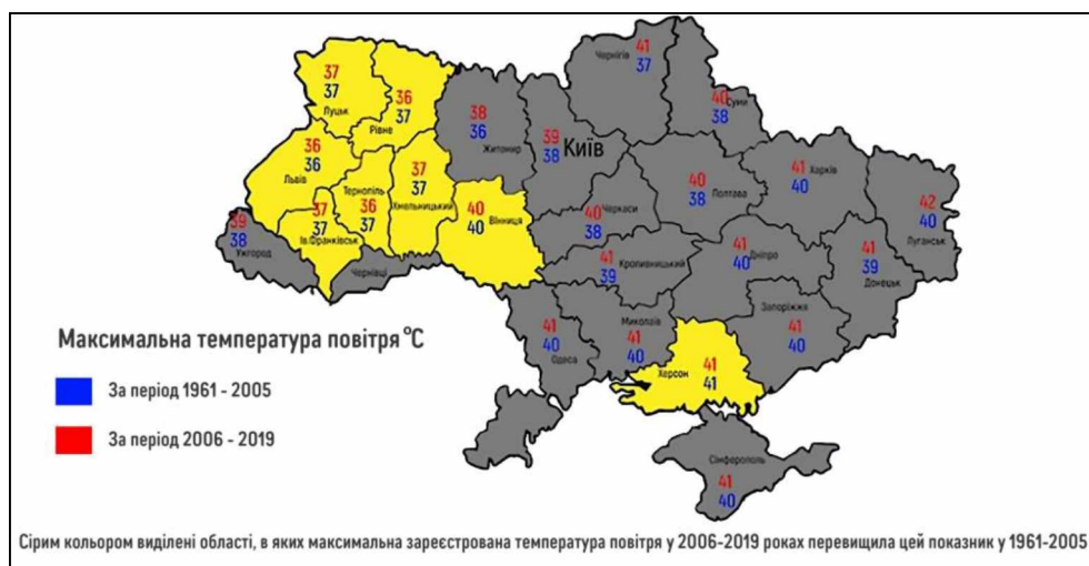
Рис. 2. Абсолютний максимум температури повітря, зареєстрований в областях України за даними Міністерства захисту довкілля та природних ресурсів України

Зауважимо, що фатальним результатом глобального потепління є танення льодовиків. Так, протягом останніх 10–15 років втрати льодовиків зросли до п'яти разів, що, звичайно, безпосередньо впливає на рівень світового океану. При цьому вода піднімається сьогодні в 2,5 рази вище, ніж це спостерігалось 10 років тому. Згідно прогнозів саме через дані проблеми до 2050 р. у світі певна кількість території та населених пунктів зокрема буде змито водою або стануть повністю затоплені [7].